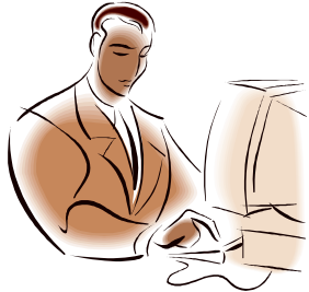
既存のFAINS利用輸入者