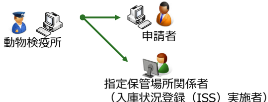
動物検疫所からの連絡通知方法及び連絡内容の確認業務