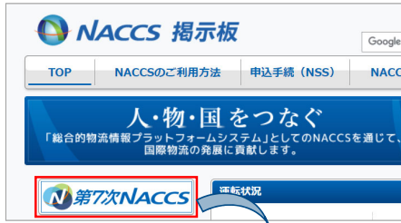
業務仕様書（第7次NACCS見え消し版）

URL : https://bbs.naccscenter.com/naccs/dfw/web/dai7ji/index.html