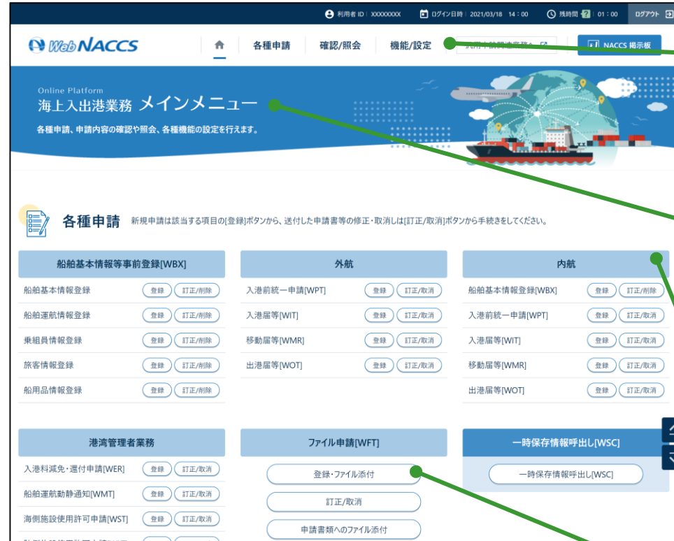
海上入出港業務トップページ案（次期）