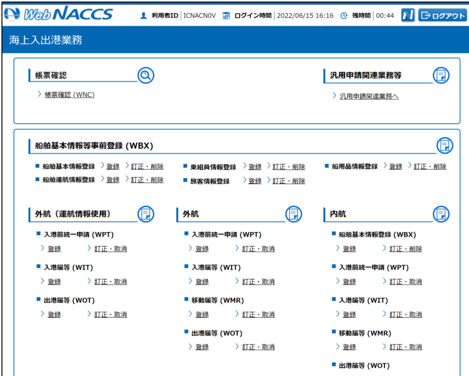
海上入出港業務トップページ（現行）

「海上入出港業務」「輸出入通関・貨物関連業務」について、利便性・操作性等を考慮した改善を行う。