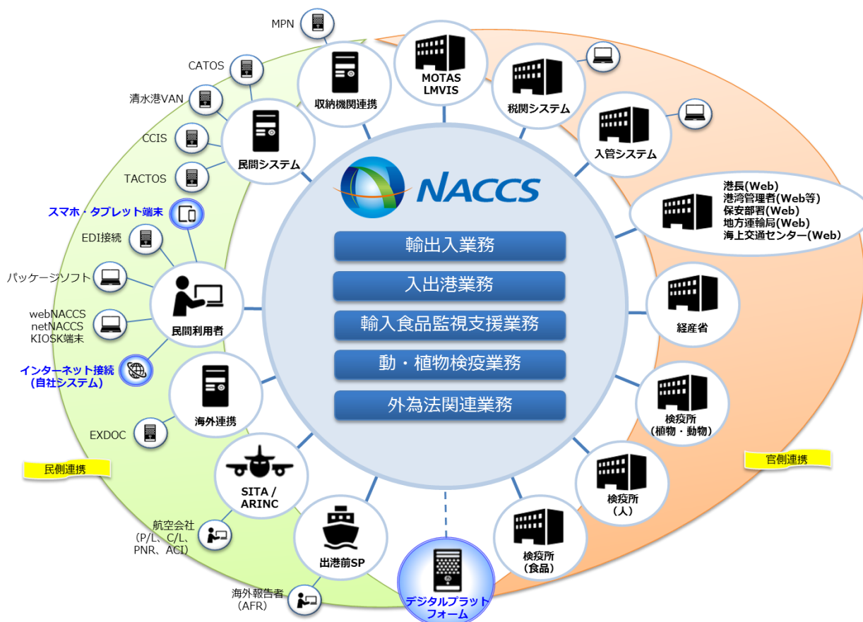
【第7次 NACCS で想定される外部システムとの連携図】