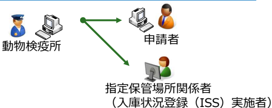
動物検疫所からの連絡通知方法及び連絡内容の確認業務